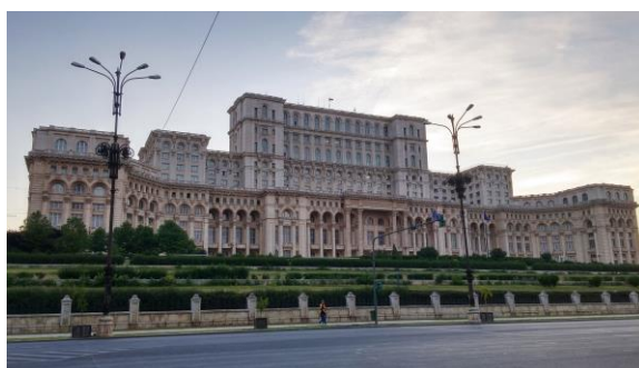
Palatul Parlamentului

În cazul în care Senatul și Camera Deputaților, în ședință comună, îl acuză pe președintele de înaltă trădare, Președintele este suspendat din drepturi și îndatoriri de drept. Acuzațiile sunt judecate de Înalta Curte de Casație și Justiție. Președintele în exercițiu este destituit de drept, dacă este găsit vinovat de înaltă trădare.